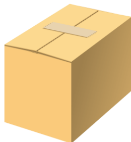
ダンボールベット 組立・解体・体験