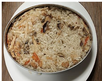
アルファ米を使った パッククッキング